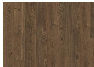
Smoky CLA 200