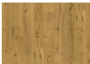
Yosemite CLA 200