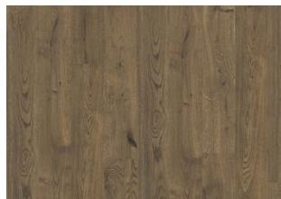
Yellowstone CLA 200