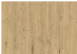
Kappadokien CLA 200