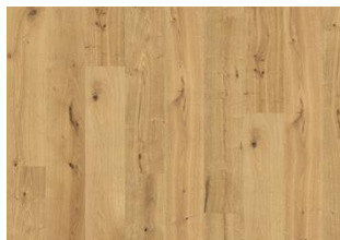
Grand Canyon CLA 200