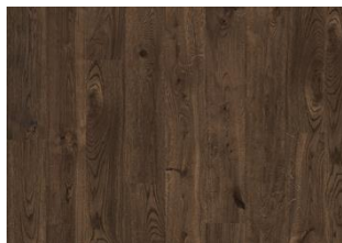
Rocky CLA 200