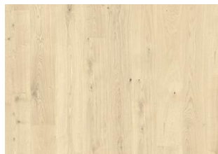
Bwindi CLA 200