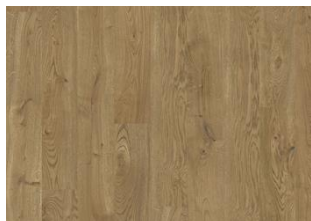
Serengeti CLA 200